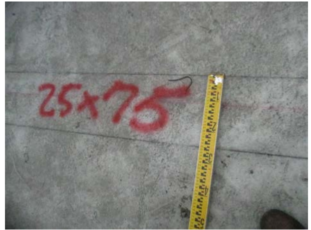
說明 8：放樣檢核噴漆標註