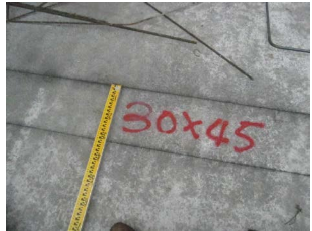
說明 4：放樣檢核噴漆標註