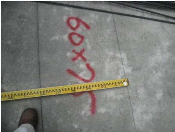
說明 9：放樣檢核噴漆標註