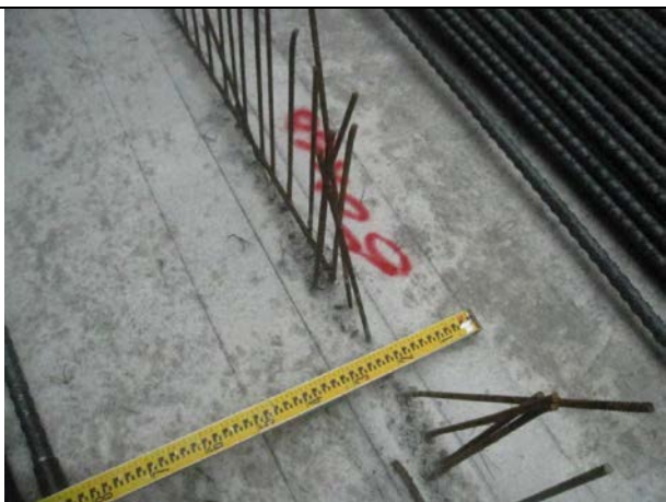
說明 5：放樣檢核噴漆標註