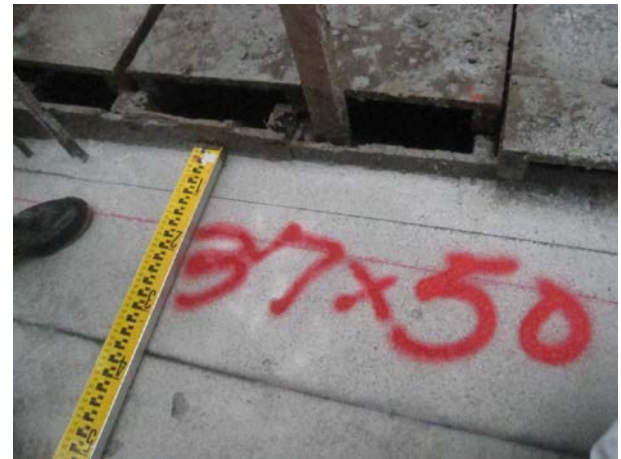
說明 10：放樣檢核噴漆標註