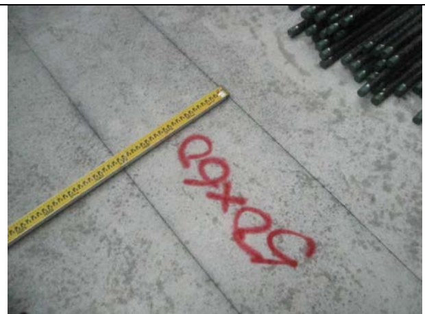
說明 6：放樣檢核噴漆標註