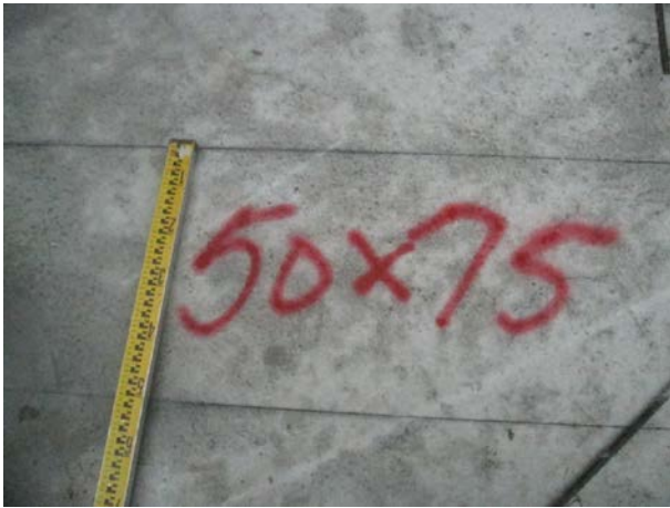
說明 7：放樣檢核噴漆標註